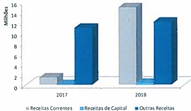
Gráfico 5- Evolução da despesa - 2017 a 2018

As restantes rúbricas registaram um decréscimo na despesa paga. No que se refere às outras despesas correntes, a redução deve-se à quebra dos juros recebidos de aplicações em CEDIC e consequente impacto na retenção de IRC.