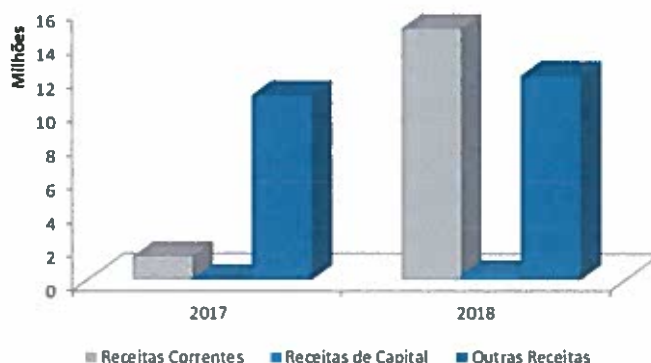
Gráfico 4- Evolução da receita por agrupamentos - 2017 e 2018